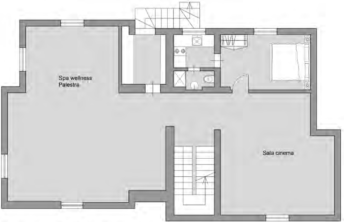
PIANTA PIANO INTERRATO